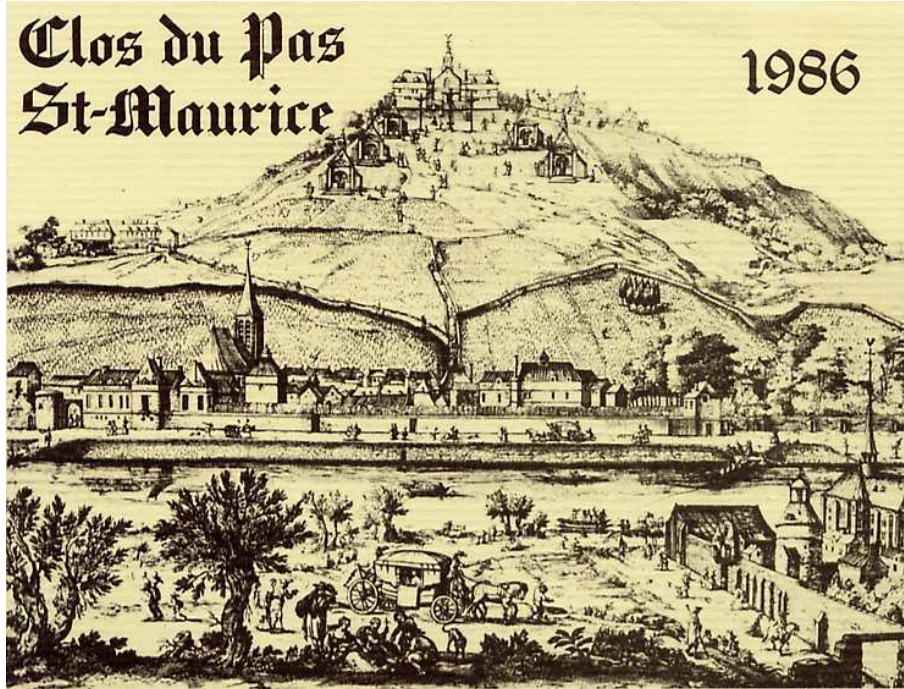
Domaine de la Ville de Suresnes