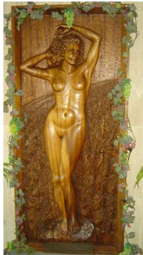
Surena : ce bas-relief trône dans la maison des vignes →